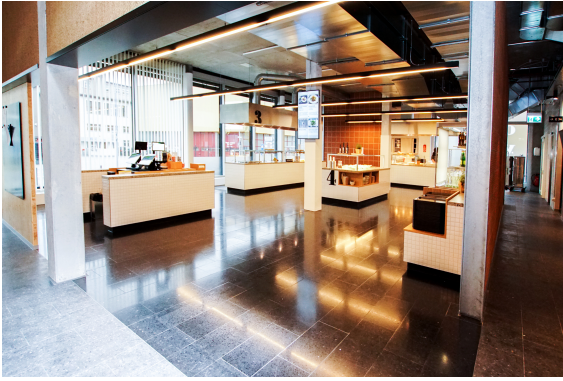
Free Flow Bereich