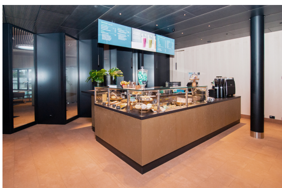
Kaffee- / Shopbar