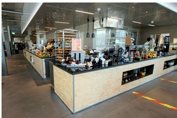
Cafeteria / Bakery