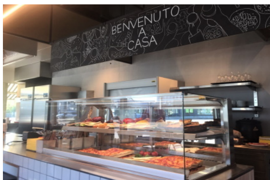
Benvenuto a casa

Trotz der nicht einfachen Ausgangslage konnte die junge Familie Cosi ihr erstes Restaurant im Oktober 2020 erfolgreich eröffnen. Das promaFox-Team wünscht ihnen weiterhin viel Erfolg für die Zukunft und Freude mit ihrer Lokalität.