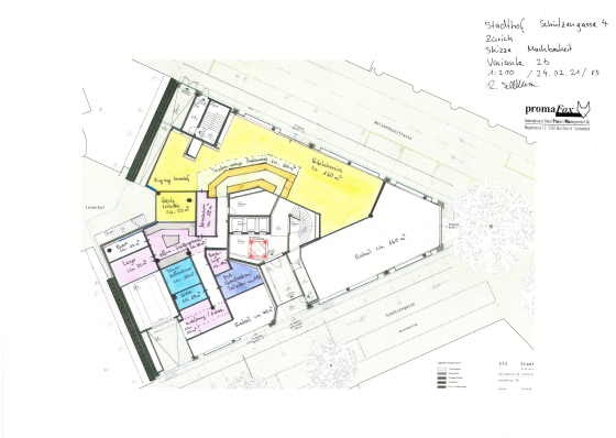
Projektskizze Restaurant klein