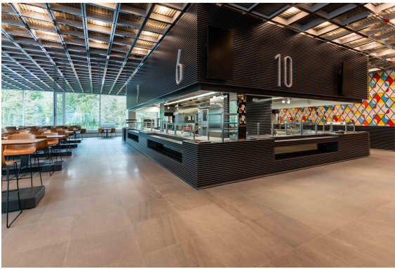
Mitarbeiterrestaurant © 2020, Tobias Rehberger