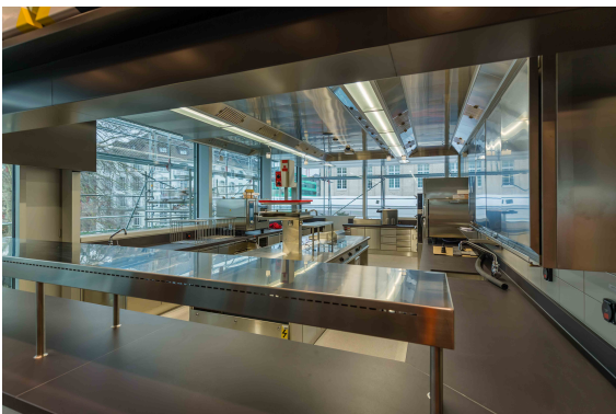
Küche Casual Dining