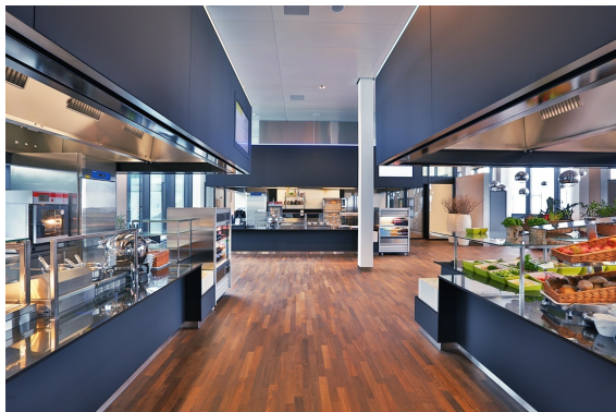
Food Island "Mercato"