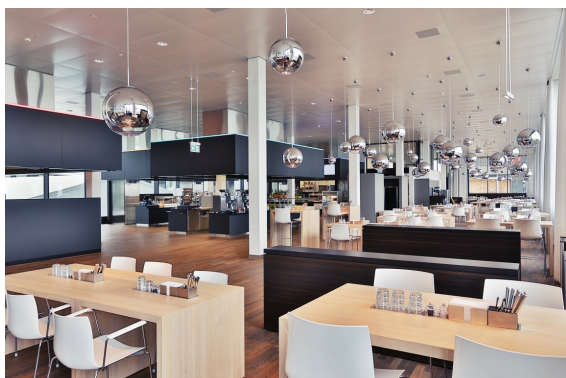
Gästezone Food Island "Mercato"