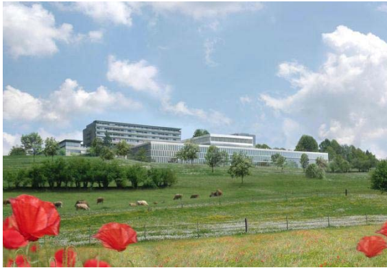
Klinikgebäude mit Neubau