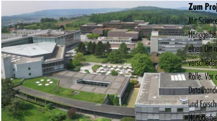
Areal Campus Science City