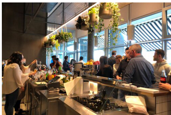
Bar / Pizzacounter