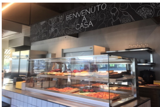
Benvenuto a casa

Trotz der nicht einfachen Ausgangslage konnte die junge Familie Cosi ihr erstes Restaurant im Oktober 2020 erfolgreich eröffnen. Das promaFox-Team wünscht ihnen weiterhin viel Erfolg für die Zukunft und Freude mit ihrer Lokalität.